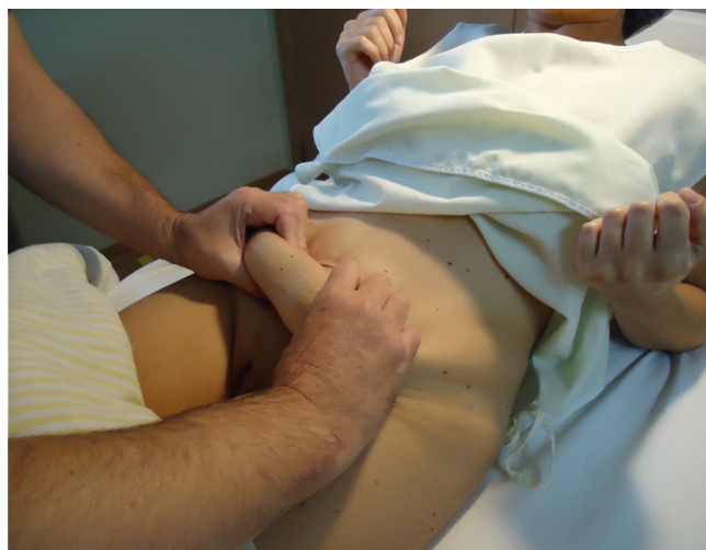
Figura 2. Manobra bimanual.

Para a escolha da técnica, através do uso do algoritmo, dois parâmetros foram previamente considerados: 1) A distância da pube ao umbigo, geralmente de 14 a 15 cm, ao nível de L3-L4 17,18 ; 2) A flacidez da pele, evidenciada pela manobra bimanual: o paciente era colocado em decúbito dorsal, apoiado sobre os próprios cotovelos fletidos, apresentando assim, uma pequena flexão anterior do tronco (Figura 2). O examinador pinçava o tecido abdominal flácido com ambas as mãos, checando se o nível do umbigo atingia a região púbica: o tecido a ser excisado estava contido entre o polegar e os outros quatro dedos das mãos do examinador (Figura 2). Considerando estes parâmetros, os pacientes eram classificados em cinco diferentes grupos, sendo os grupos submetidos às técnicas mais invasivas (II, III, IV e V) apresentados na figura 3, de acordo com seus aspectos pré e pós-operatórios.