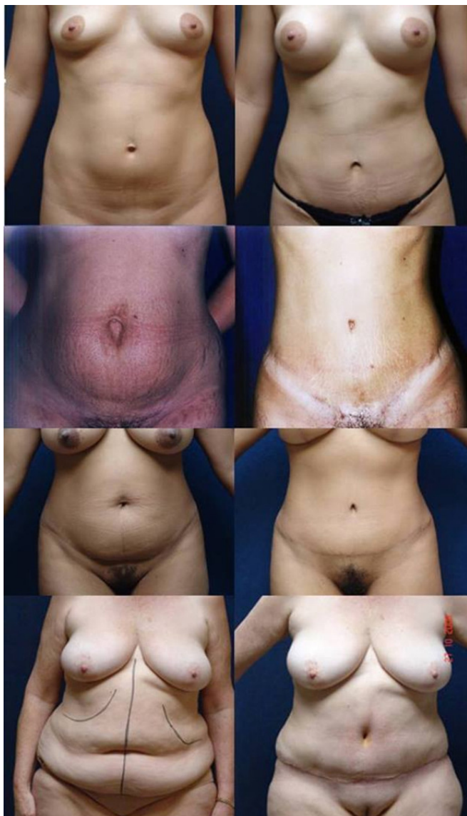
Figura 3. Pré e pós-operatório das técnicas II a V.

Em seguida, o algoritmo proposto atribuía uma técnica consagrada, para cada um dos grupos, a partir das características encontradas em cada paciente (Figura 1). O grupo da “Técnica I” compreendeu pacientes com flacidez e/ou lipodistrofia apenas abaixo do umbigo: a técnica indicada para esta situação foi a miniabdominoplastia, considerando que não havia motivos para o descolamento do retalho na porção superior do abdome, ou reposicionamento do umbigo. Quando havia flacidez no abdome superior e inferior, mas o teste bimanual demonstrava ausência de pele flácida suficiente para ressecção da cicatriz decorrente da circuncisão umbilical, duas situações eram consideradas: a primeira era quando a distância do umbigo ao pube era maior ou igual a 15cm, um indicativo para a “Técnica II”, quando se procedia à